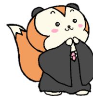
裁判所ナビゲーター 「さいたん」

広島高検・広島地検・広島法務局 広島高裁・広島地裁・広島家裁 広島弁護士会・法テラス広島 共催